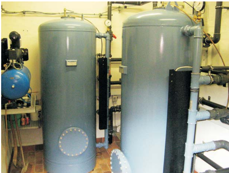
Filter og kompressor

I år 2000 var filteret til rensning af grundvandet tjenlig til udskiftning, og det blev erstattet af 2 trykfiltere med automatisk skylleanlæg.