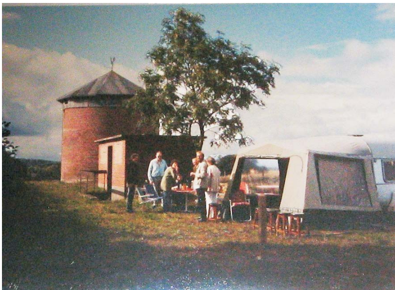
26 september 1987 var miljødag i de 12 EF- lande. (I den forbindelse blev der holdt åbent hus.)