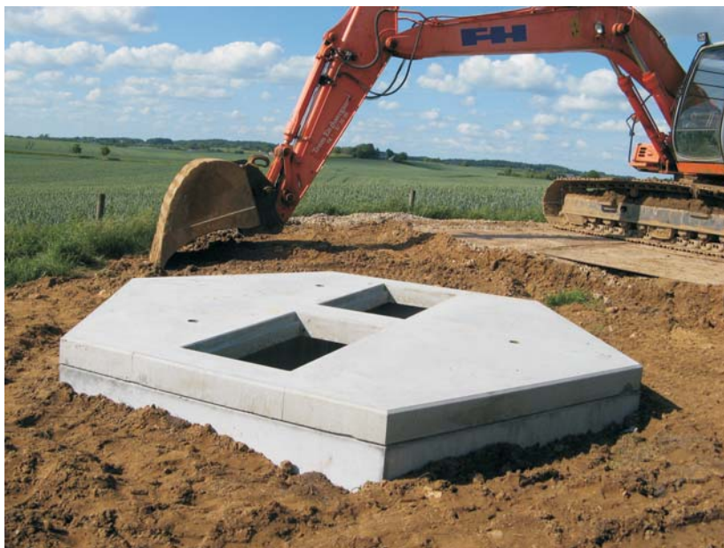
Skyllevandstank 21m 3

Med de udskiftninger og vedligeholdelser, der gennem årene er foretaget, fremstår vandværket i dag som et moderne og velfungerende vandværk.