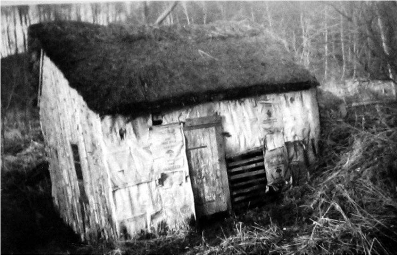
Huset over vandhjulet i skoven.